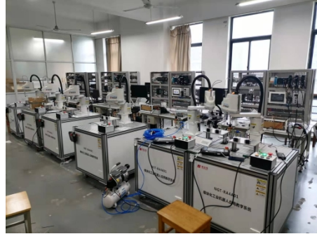
图1 共建汇川PLC实训室