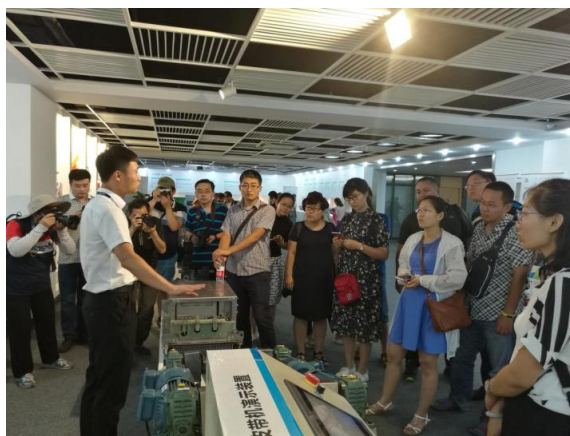
图2 共同开展各类师资培训