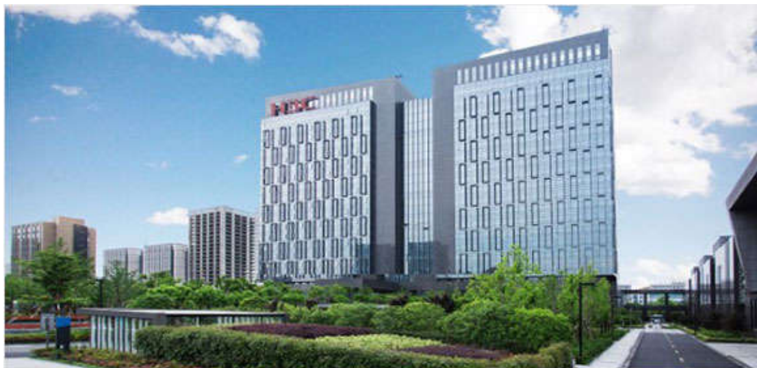
图 1 新华三集团杭州总部

“新华三”将整合优势，进一步开拓中国市场和全球业务，成为数字化解决方案的领导者。新华三也将受益于紫光和清华的多元资源、资金实力与科研优势。我们将以三十年深耕教育培训领域的品牌积淀，结合清华大学、紫光集团在人才、教育、资金、社会资源等方面的优势以及打造全产业链的能力，迎来巨大的机遇和更加广阔的发展空间。