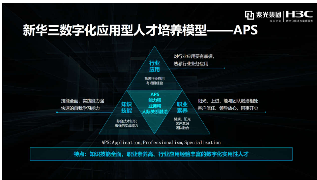
图 2 人才核心能力培养模型

通过技术培训、职业规划、大赛锻炼等方式培养“零距离”上岗，综合素质达到企业要求的优秀毕业生。