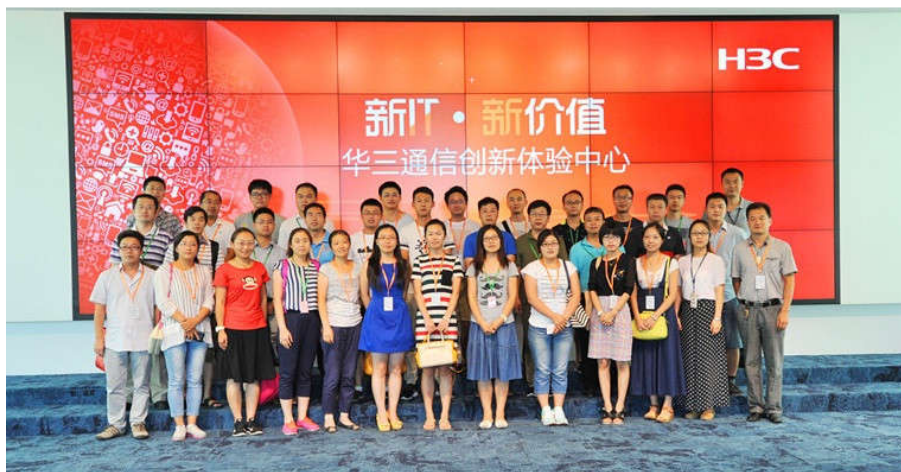
图 5 讲师培训合影