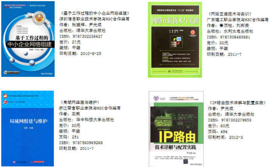
图 6 部分联合开发教材