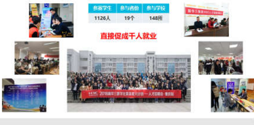
图 8 部分省份招聘会现场