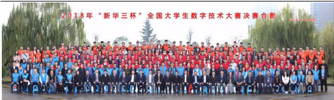
图 10 新华三杯大赛

新华三杯大赛至今已成功举办了十届，2018年起与全国高等院校计算机基础教育研究会联合主办，作为国内厂商举办的规模最大、周期最长的竞赛活动，大赛一直以来以促进教学、提升就业质量为目标，旨在加强院校、企业、学生三方的互动性，提高学生的技能水平和职业素养，以满足企业的用人需求。从举办之初，便得到社会各界的好评和关注。