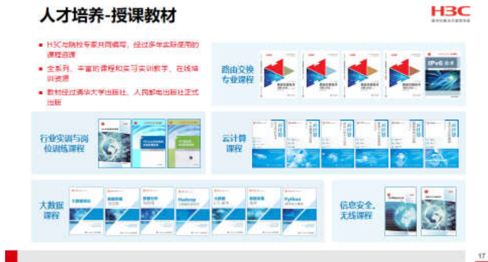
图3 H3C 课程体系