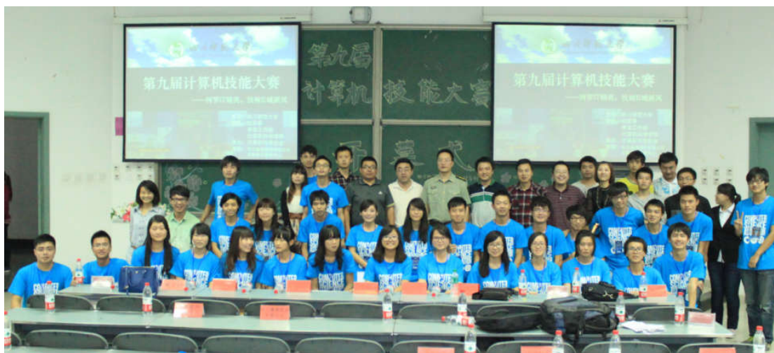
图 11 网络学院校内技能大赛

除新华三杯大赛支持政策外，H3C 对网络学院举办的校园计算机网络技能大赛也同样给予大力支持。